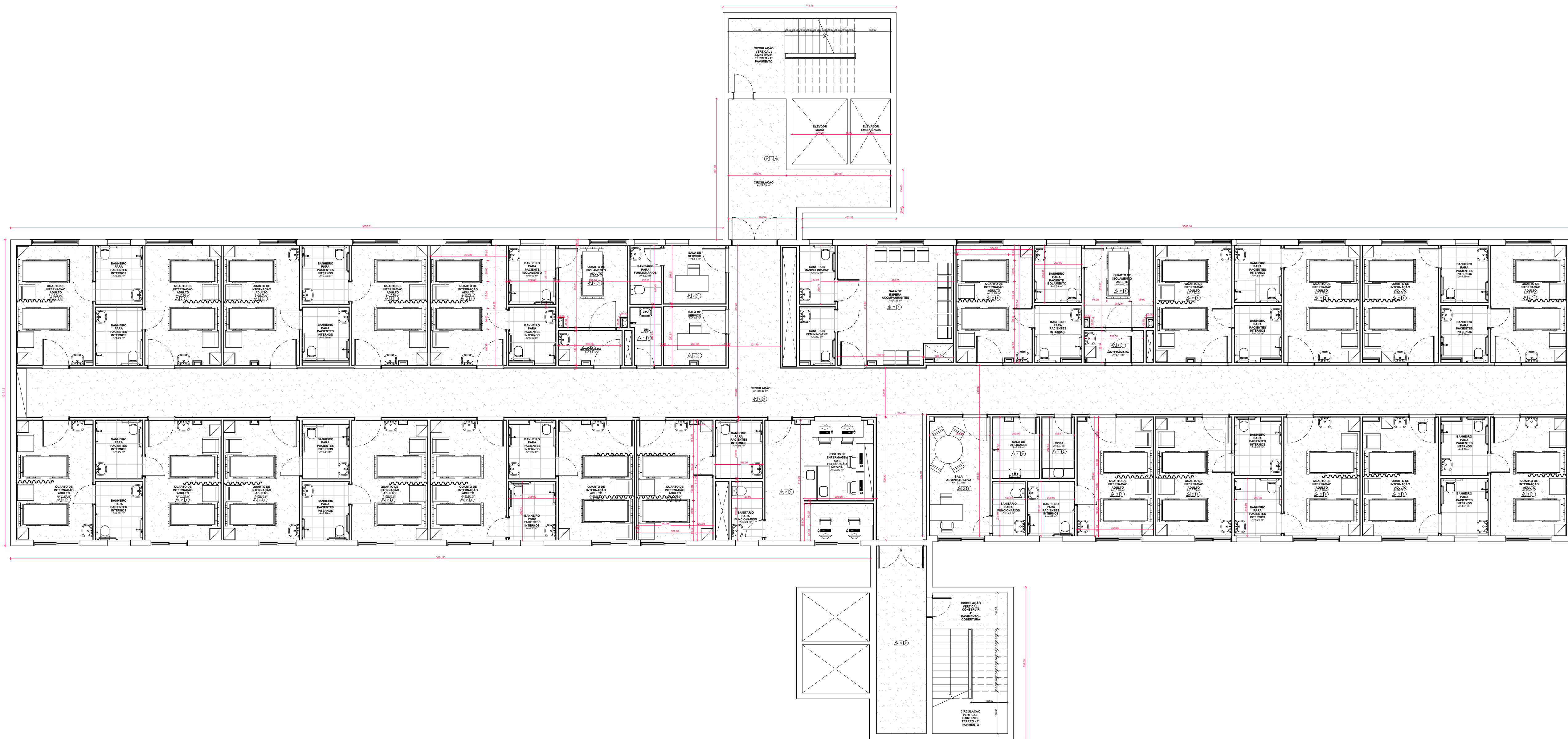
PLANTA BAIXA PAVIMENTO TIPO ESCALA: 1/100