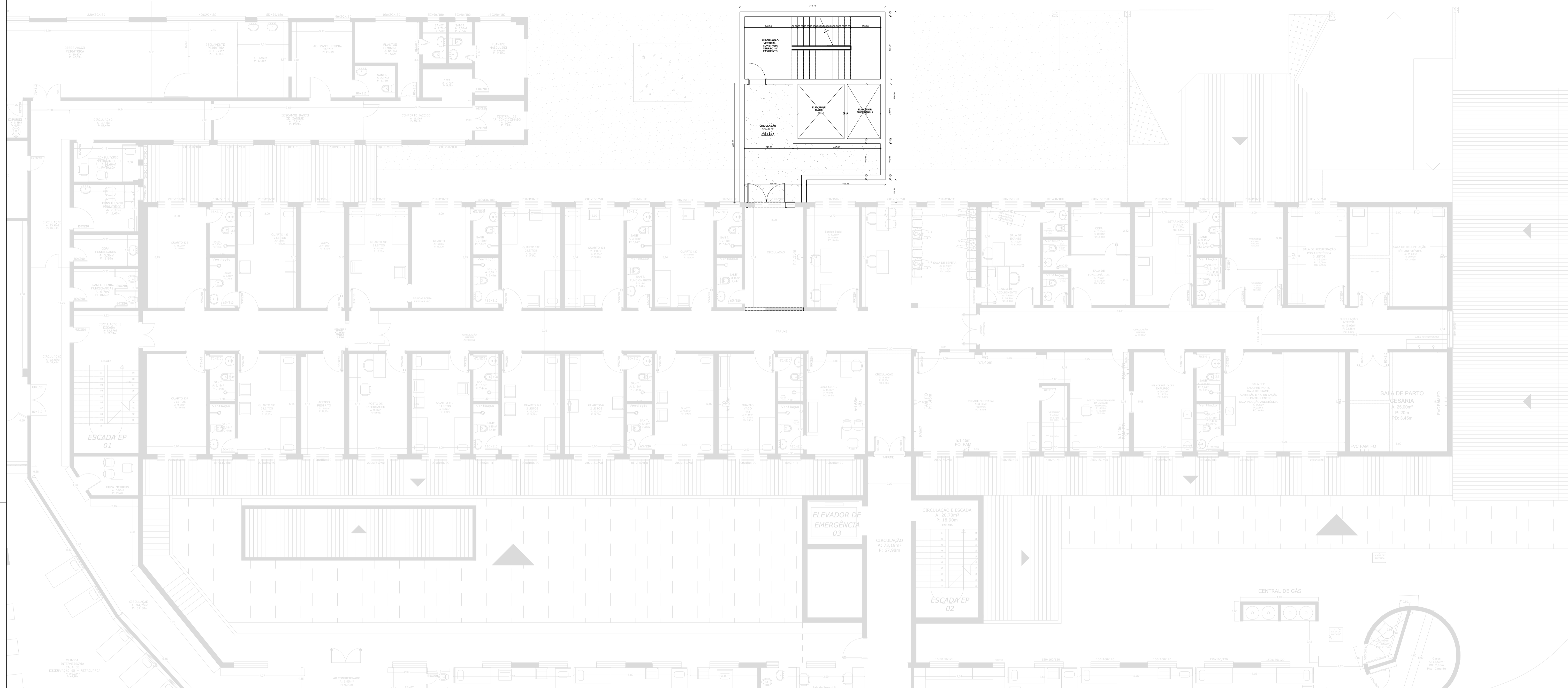
PLANTA BAIXA SEGUNDO PAVIMENTO ESCALA: 1/100